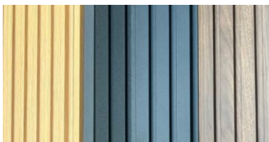
°Roble °Negro °Grafito °Caramel

Nuestro Wallpanel de MDF 3D para interiores están disponibles en una variedad de tamaños, grosores, diseños y colores para los distintos requerimientos de cada proyecto. Su núcleo esta fabricado bamboo cubierto con una chapa de PVC. Wallpanel es un nuevo tipo de tablero de decoración de interiores que se utiliza principalmente en hoteles, clubes, decoración del hogar, complejos turísticos, centros comerciales, casas de lujo, oficinas, etc. De muy baja mantención, fácil de limpiar, es a prueba de humedad y mohos por lo que incluso puede instalarse en baños.