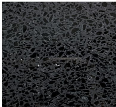
CRYSTAL BLACK PULIDO