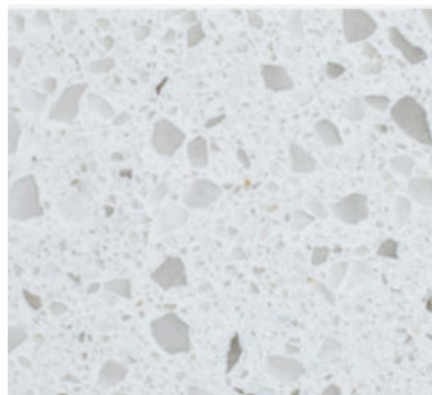
CRYSTAL WHITE PULIDO