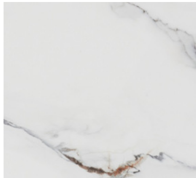
CANON IN WS PULIDO