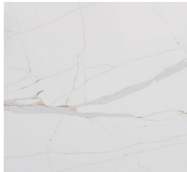
DAWN LIGHT PULIDO