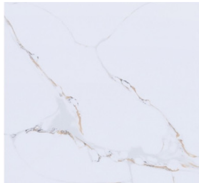
MARBLE MIST PULIDO