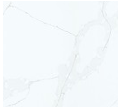
PASTEL CELLO PULIDO