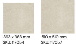
363 x 363 mm SKU: 117054