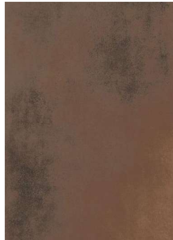
117180 - Oxide Copper 60x120 cm