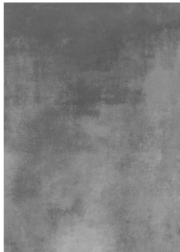
117179 - Oxide Steel 60x120 cm