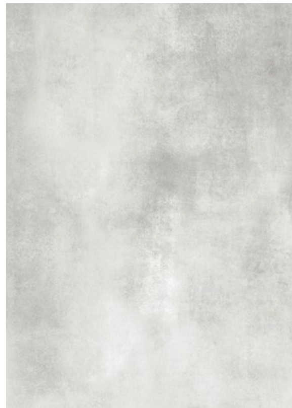
117178 - Oxide Aluminium 60x120 cm